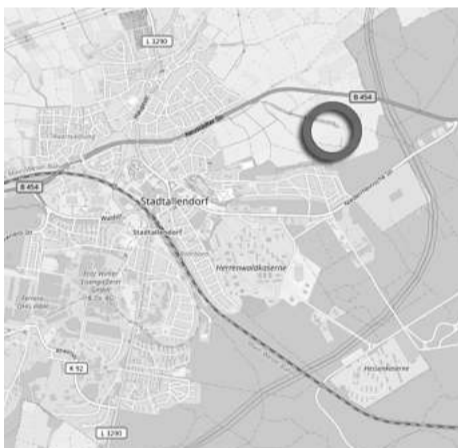
Räumliche Lage (OpenStreetMap – unmaßstäblich)

Die räumliche Lage des Plangebiets sowie der Entwurf des Bebauungsplans gehen aus den nachstehenden Übersichtskarten hervor (jeweils fett umrandeter Bereich).